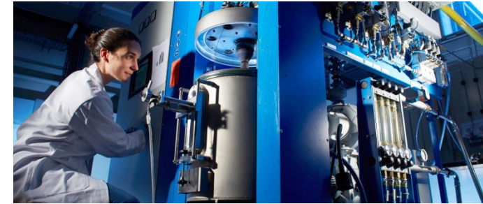
Ingénierie@Lyon